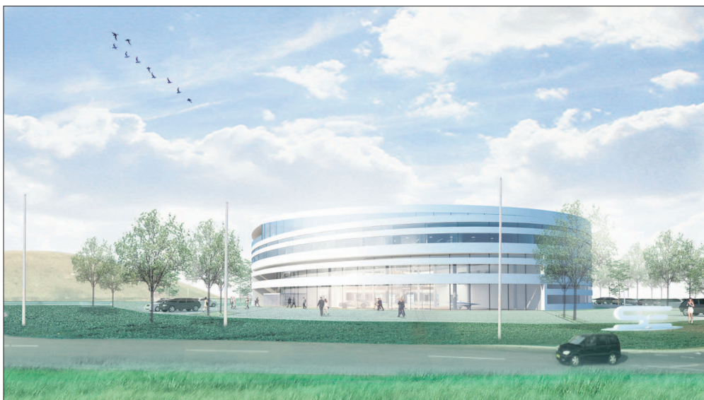
I dag tages første spadestik til SE's nye opsigtsvækkende domicil, der kommer til at se således ud.